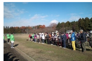
↑ / W教室のイメージです。

日程や参加者募集方法、参加費等を調整中です。決定及び詳細は、次号の12月号で案内いたします。延べ5日間の予定で、ウォーキングの基礎、美しい姿勢、靴の履き方、歩幅を知る、スポーツとしてのウォーキング、継続して行う効果等の内容にて、実技を主体とした内容にて行います。