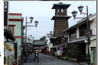
川越・上 / 蔵造り街並・下 / 時の鐘