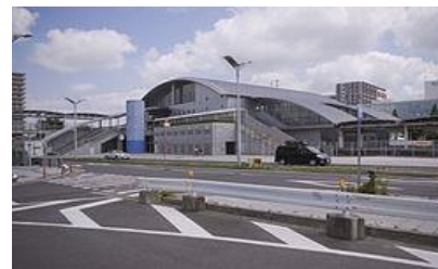
ひたち野うしく駅