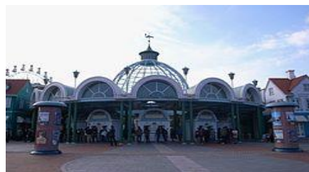
アンデルセン公園