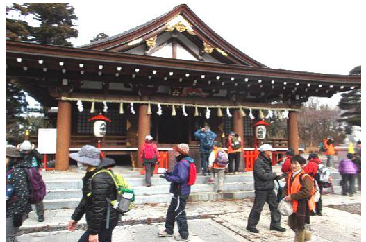
安良川八幡宮で参拝