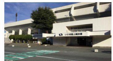
いわき陸上競技場