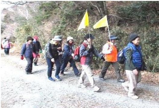
朝香神社参拝後ゴール目指して

昨年は、2回の全国赤水ウオークや塩原一泊ウオークなど、クラブ内は勿論、他クラブの皆さんとも素晴らしい交流が