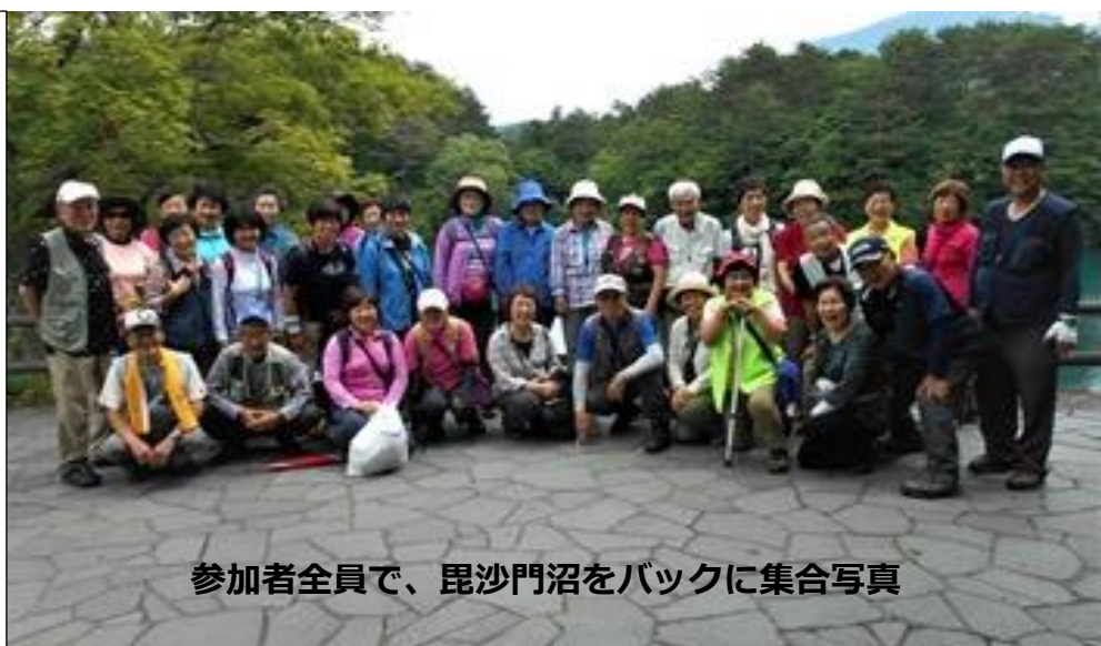
参加者全員で、毘沙門沼をバックに集合写真

毘沙門沼のほとりに、クマが出たとか。空砲で追いついたそうです。みなさん無事でよかったです。「クマ出没注意」の看板は本当でした。心配していた雨も降らない、ウォーキング日和の二日間でした。「日頃の心掛けが…」の声が、やっぱり出ました。でも本当にそう思ってしまった。