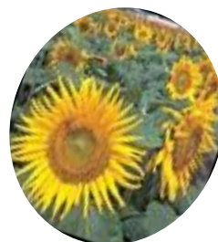
「野木町の花」らまわり