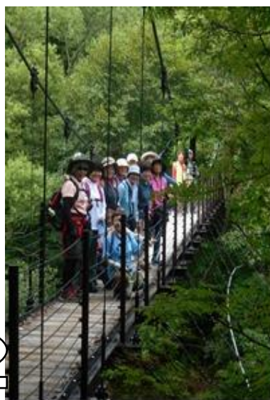
中瀬沼ルート唯一の吊橋

毘沙門沼のほとりに、クマが出たとか。空砲で追いついたそうです。みなさん無事でよかったです。「クマ出没注意」の看板は本当でした。心配していた雨も降らない、ウォーキング日和の二日間でした。「日頃の心掛けが…」の声が、やっぱり出ました。でも本当にそう思ってしまった。