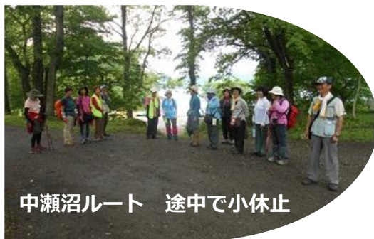
中瀬沼ルート 途中で小休止