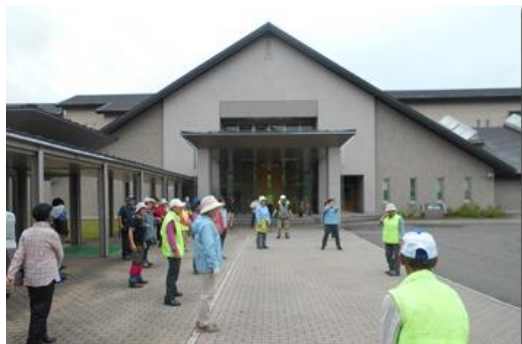
休暇村裏磐梯ホテル玄関前に集合