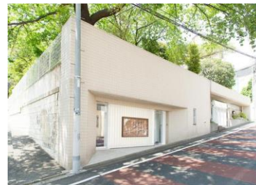
美空ひばり記念館