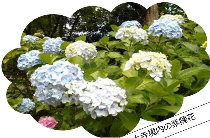
本土寺境内の紫陽花