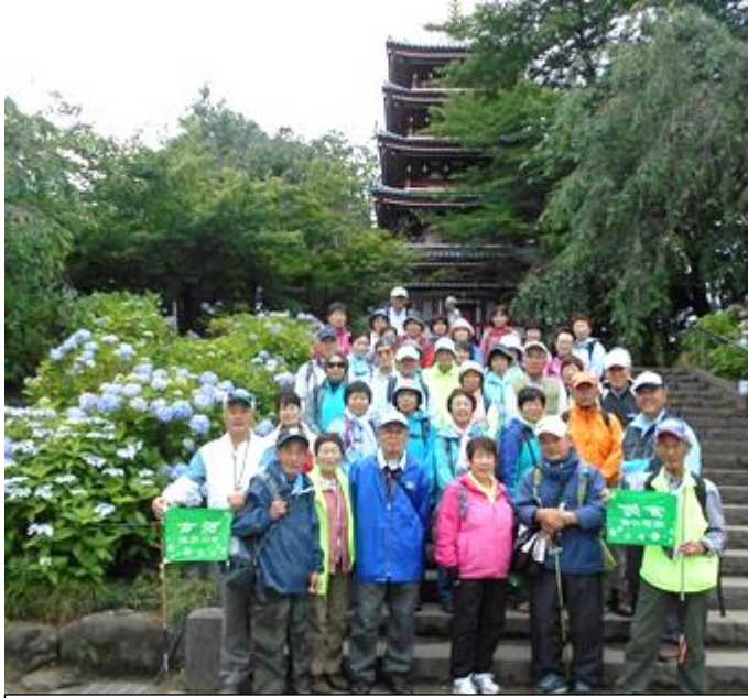
『本土寺の紫陽花と五重塔』 参加者 41 名