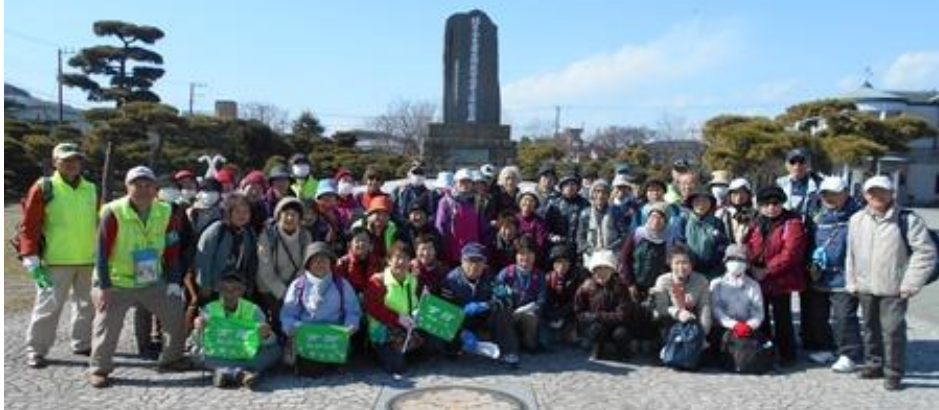
2月17日（土）【久里浜ペリー記念館・くりはま花の国を歩く】

「ペリー記念館」にて記念写真 一般の方11名を含め55名での 例会。「くりはま花の国」は、 丘というより小山！！ 意外なほど標高差があった。 花の季節としてはオフシーズン でしたが、菜の花や香り良いス トックが迎えてくれました。広 大な敷地に「ポピー」の苗が霜 よけの下で春を待っていました