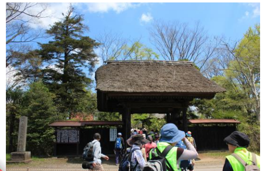
【延命寺】将門ゆかりの寺 山門は茅葺切妻造り 別称「島の薬師」