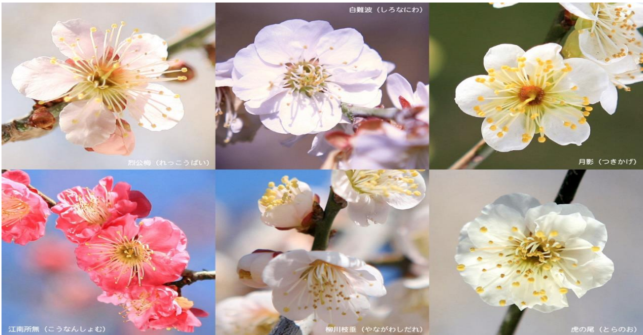
上段左より 裂公梅、白難波、月影 下段左より 江南所無、柳川枝垂れ、虎の尾（茨城県のHP より）