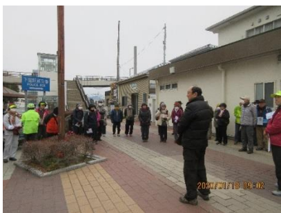
下館駅前での出発式