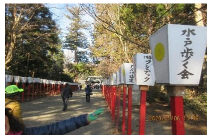
水戸歩く会、奮発したね