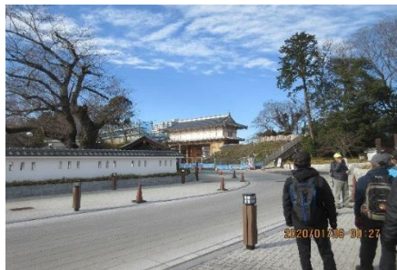
復元工事の大手門