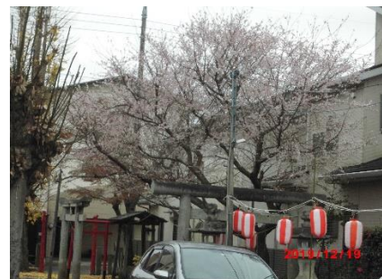
田中稲荷神社の桜