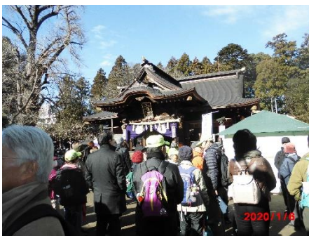
常磐神社