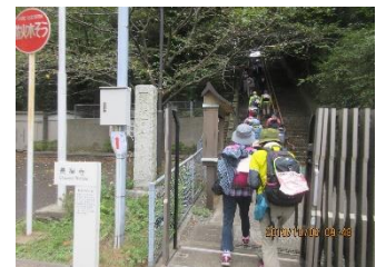
倉持さん道紀行 50 回完歩おめでとう