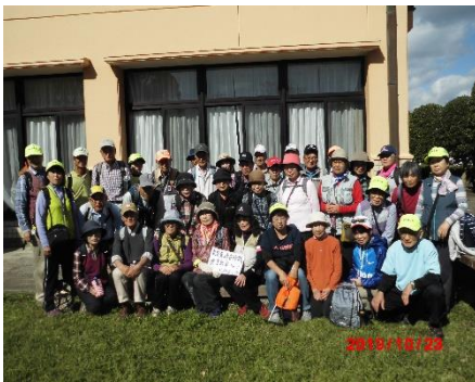
記念撮影（村松コミセン）