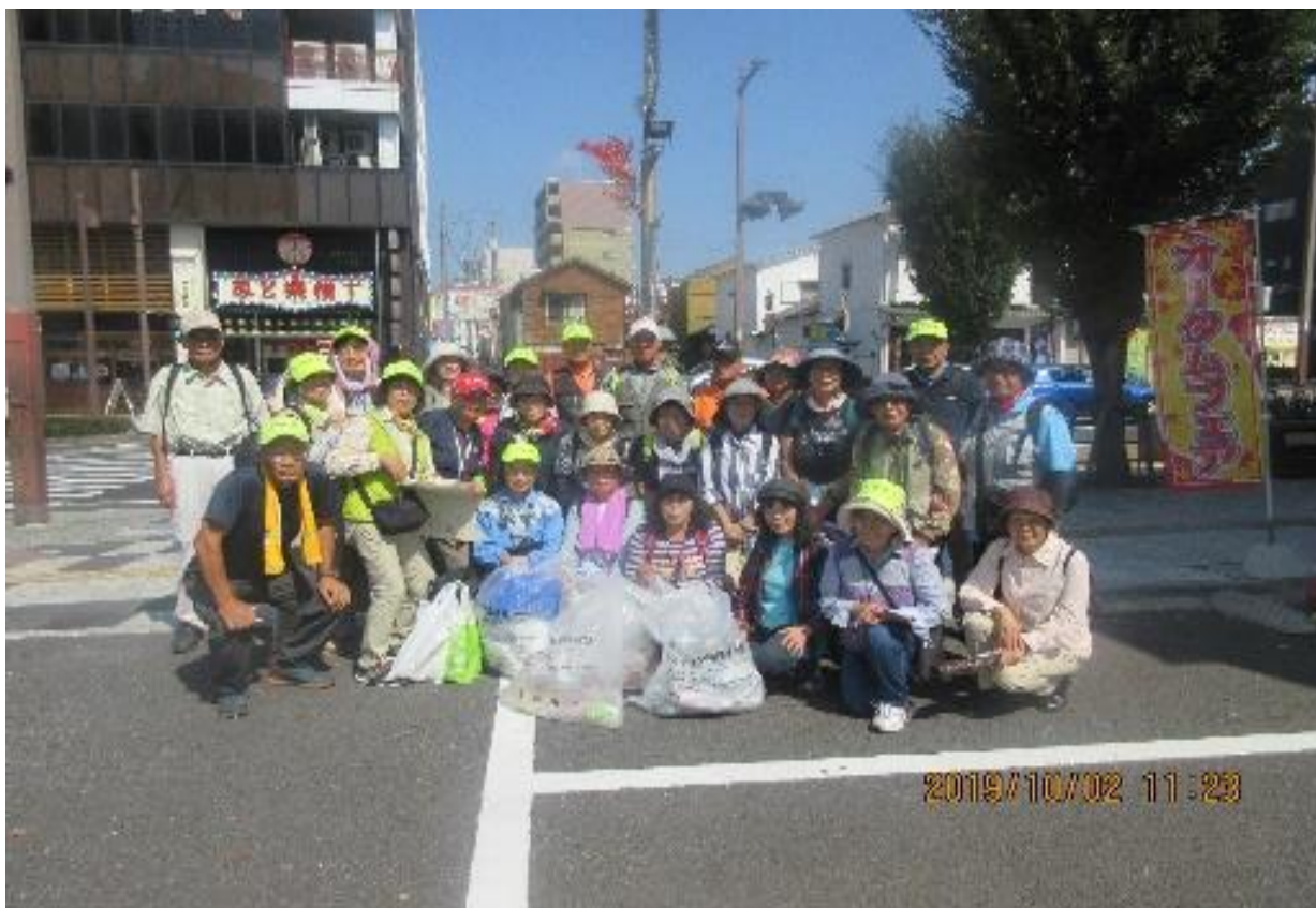
10/2 大通りクリーンウォーク終了後