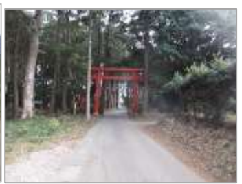
④飯沼街道を跨ぐ一之鳥居