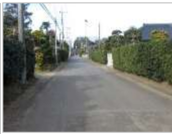
③築地塀の残る飯島宿