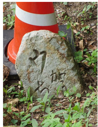
印部石(しるびいし)