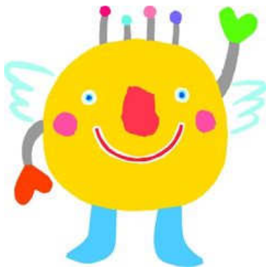
マスコットキャラクター 「いぱラッキー」

2019年には、茨城国体が開催されます。2月16日に開催された「第6回常任委員会」において、「正式競技」と「デモンストレーションスポーツ(デモスポ)」の全種目が決定されました。