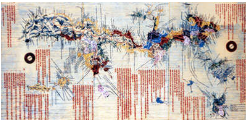
沖縄本島と周辺離島を測量した地図「琉球国之図」1796年製作 尚財団 収蔵

何かの折に、「琉球国之図」を見る機会がありましたら、このコラムを思い出していただければ幸いです。