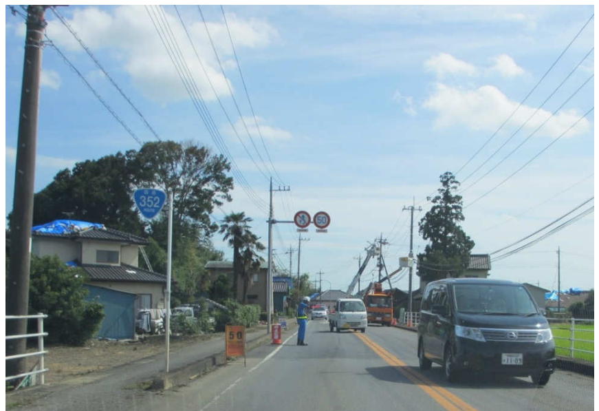
<鹿沼市付近の竜巻被害～左家屋、右手奥の家屋、屋根にブルーシートが>

寺田寅彦の弟子・坪井忠二は、戦後、現国土地理院と深く関わり、地震と重力の関係を解明し「日本の重力分布図」を作成するなど活躍した地球物理学者(昭和 38 年東大教授退官)でした。