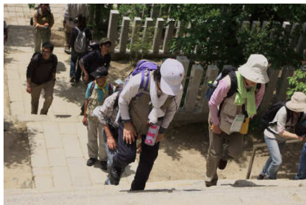
第7回つくば国際W大会 6月1日(土) この階段を上ると筑波山神社 休憩地点です

コメント：私は太極拳との両立で ずいぶん遅くなりまして、達成まで 13年4か月！ これを通過点に してこれからものんびり2周目に 挑戦していきます。80歳の鳩の会 まで歩きたいと願っています。