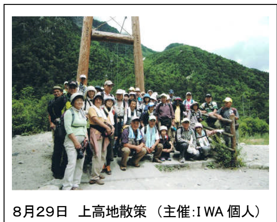
8月29日 上高地散策 (主催:IWA 個人)