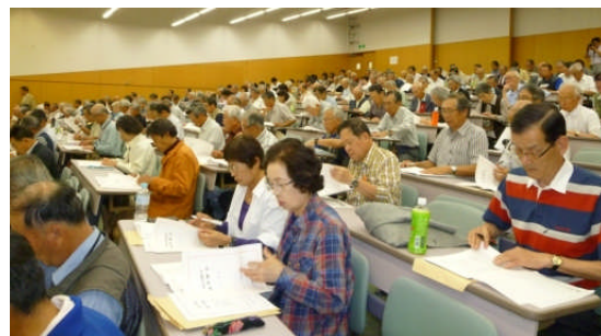
会場: 東京・国立オリンピック記念青少年総合センター