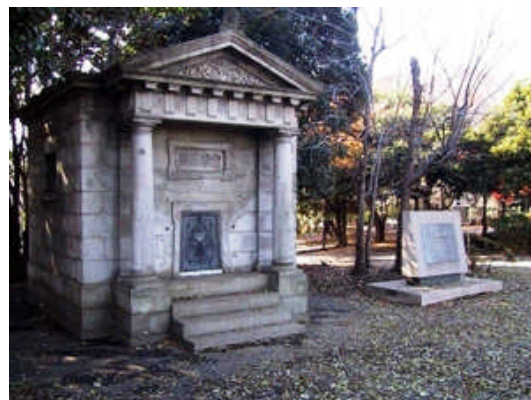
日本水準原点(東京都千代田区永田町 1-1)