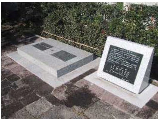
日本経緯度原点(東京都港区麻布台 2-18-1)