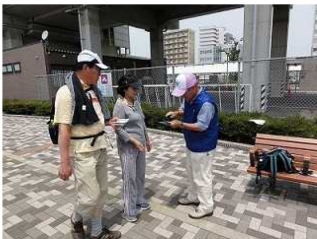
<TX研究学園駅高架下でコースのスタンプ>

1日目は筑波山神社や市街地巡りコース 2日目は万博記念公園コースや、国土地理院で 歩測大会など日頃の健脚ぶりを試していました。