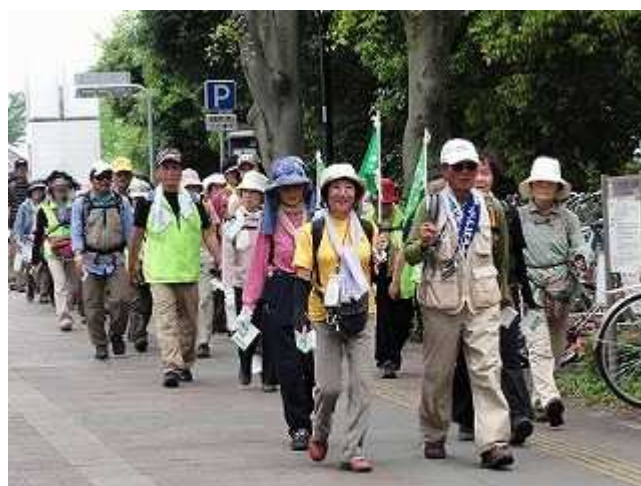
<つくば学園地区を楽しみながら歩く参加者>

会場では東日本大震災のチャリティ募金や 地元の物産展、筑波大学吹奏楽団の演奏で 盛り上がりました。