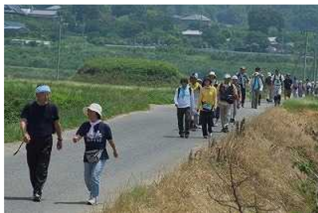
<筑波山麓むかし道・里山コース>