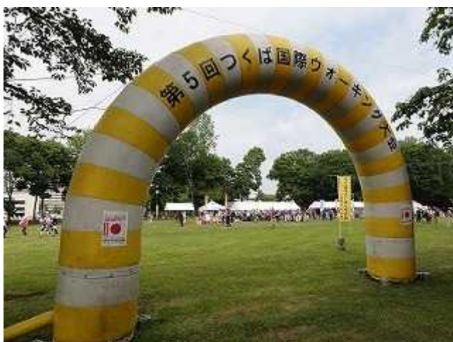
<参加者送迎用のアーチ>

参加者の皆様、共催・後援・協賛・協力をいただいた皆様、スタッフの皆様、そして天候に感謝いたします 「東日本大震災・復興支援チャリティウォーク」多くの皆様からの募金協力ありがとうございました。