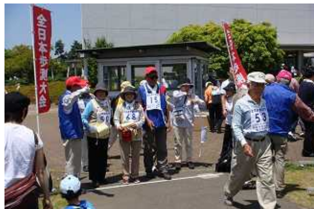
<歩測大会では30名の達人が誕生>