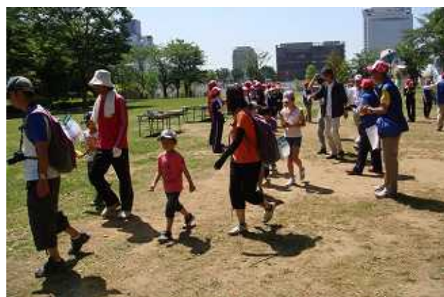
<中央会場からは、科学、公園、ショートコースをそれぞれに楽しんだ>