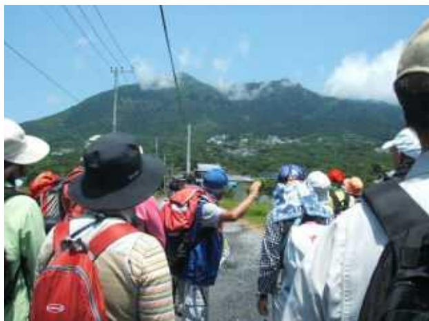
<せっかくウォークでは筑波山神社境内でガマの油売りの口上を体験>